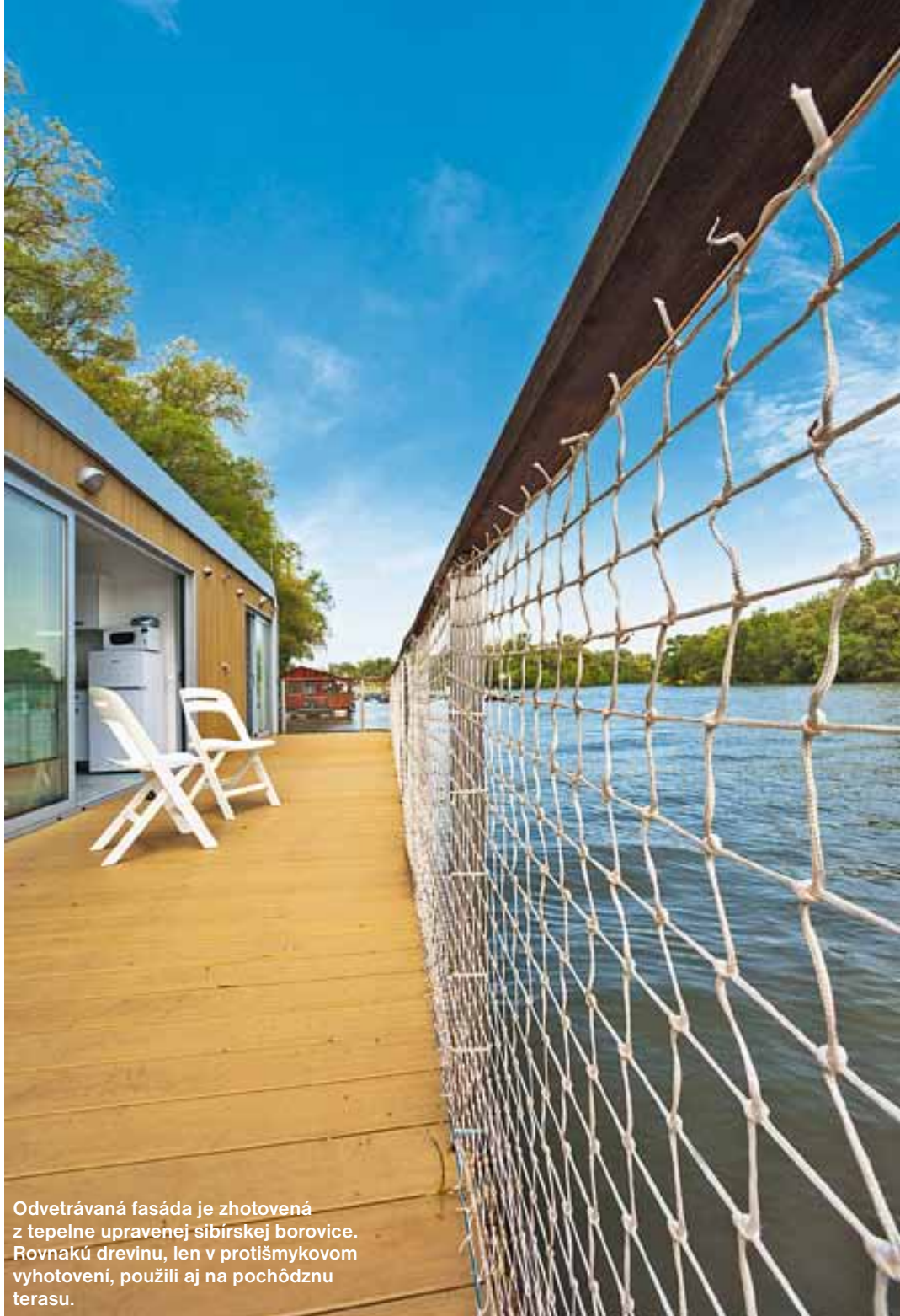
Odvetrávaná fasáda je zhotovená z tepelne upravenej sibirskej borovice. Rovnakú drevinu, len v protišmykovom vyhotovení, použili aj na pochôdznu terasu.

Objekt je ukotvený k brehu pomocou mostíka, vzpery a lán, ktoré umožňujú jeho pohyb hore a dolu spolu s meniacou sa výškou hladiny. Aj tohtoročné povodne chata prečkala bez problémov. Len v prípade, že sa voda vyleje na breh, sa na chatu dá dostať iba loďkou. Pre prípad povodní je navyše dobré mať spravenú prípravu na zapojenie okruhu pre elektrocentrálu.